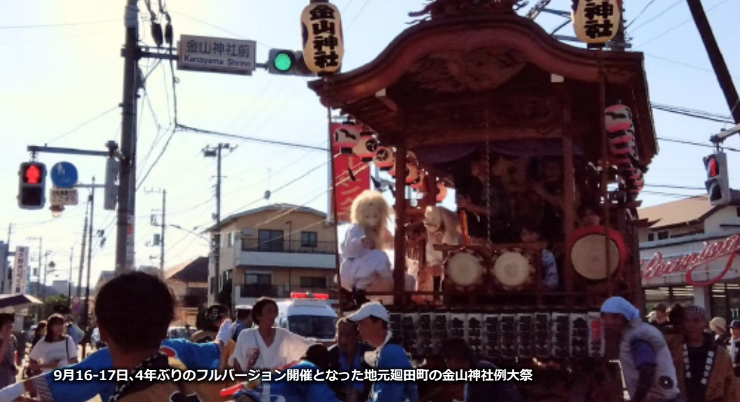
9月16-17日、4年ぶりのフルバージョン開催となった地元廻田町の金山神社例大祭